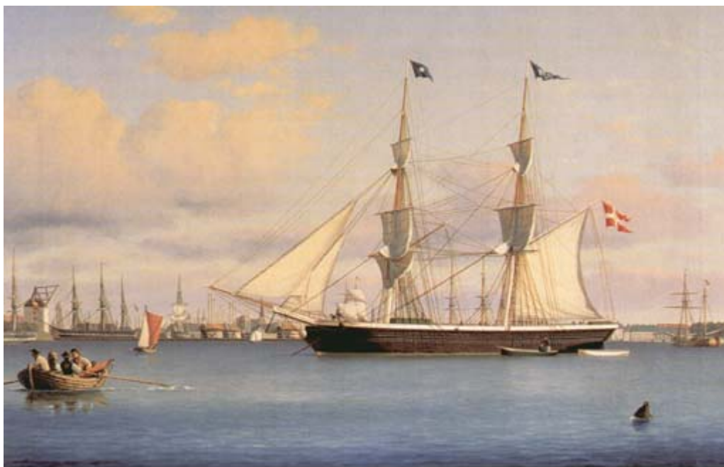
Briggen Fylla ved København