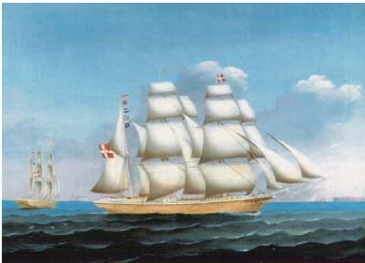
Barken Svanen (P. F. Heerings sidste byggede skib)